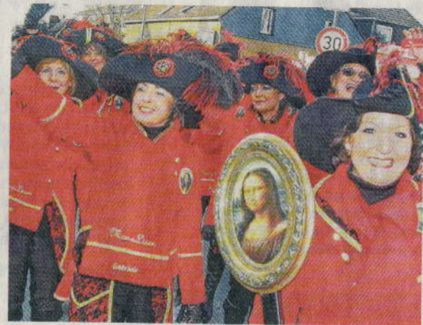
Premiere: Für die „ Mona Liesen “ aus Monheim war's gestern der erste Zug ihrer frischen Vereinsgeschichte.