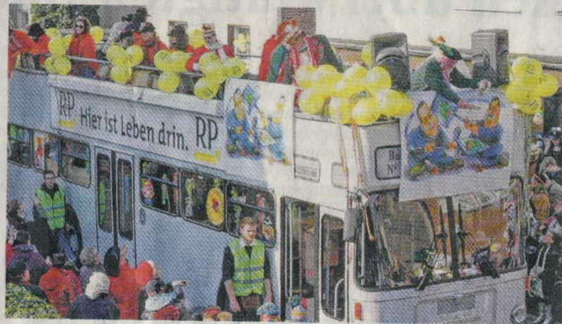
Mitten im närrischen Leben angekommen: Das Team der RP mit dem Doppeldeckerbus erinnerte auch an den innerstädtischen Streit um die Köttelallee .