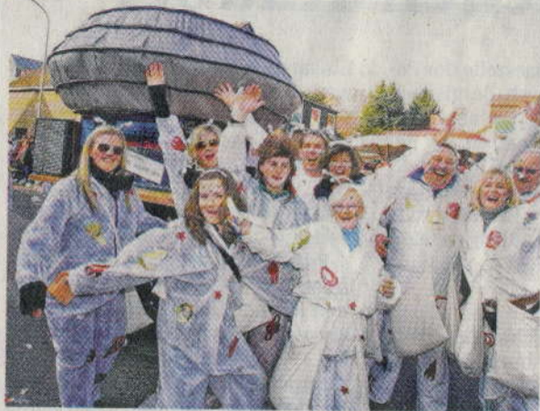
Rathaus-Ufo en miniature: Der Fußclub Rio hatte das gute Stück gebastelt – und ordentlich mit Kritik versehen.