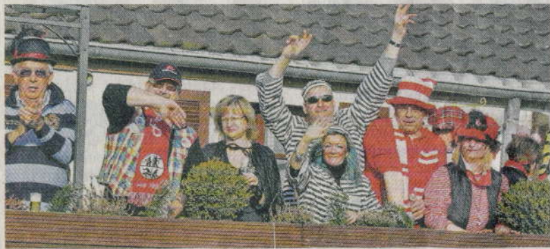
Balkontreffen: Wer so schön an der (oft lauten) Hitdorfer Straße wohnt, darf sich auch mal durch einen Narrenumzug verwöhnen lassen.