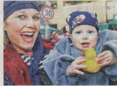
Ein RP-Entchen als Geschenk: Da lachen kleine und große Narren.