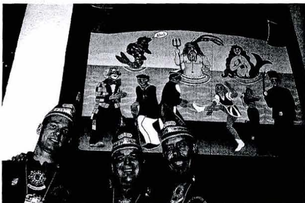
Das Hitdorfer Dreigestirn vor dem Bild mit dem Sessionsmotto.

Das neue Dreigestirn freut sich auf eine fröhliche Session